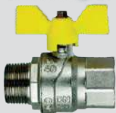
Torneira Macho x Fêmea