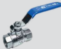
Registro Esfera Fêmea x Fêmea