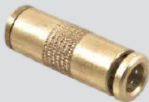
União Emenda Rápida