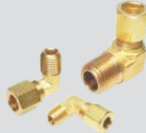
Cotovelo Macho Sem Porca