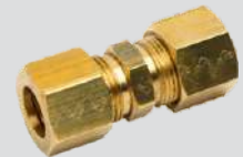
União Emenda Compressão Completa