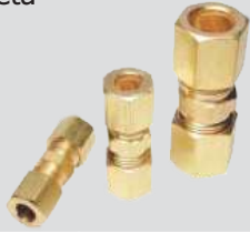
União Emenda Compressão Completa